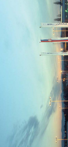
Stupnjači zemljišta za stvaranje otvaranje... Novi autobuska stanica u Novom Sadu