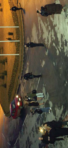
Novi autobuska stanica u Novom Sadu